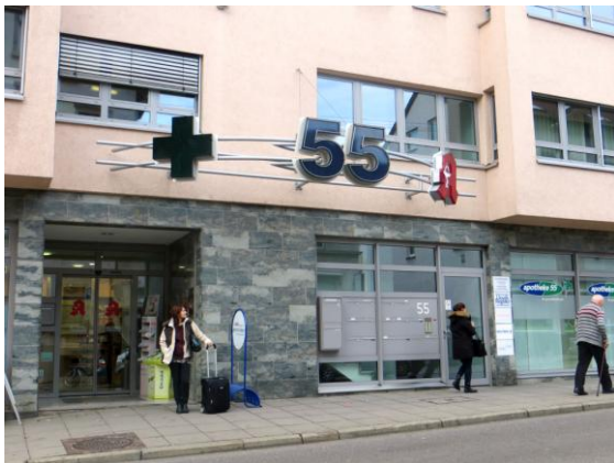
Übergang: Schwabstraße 55

Der Landesverband hatte sich entschieden, gemeinsam mit dem Körperbehindertenverein Stuttgart eine neue Bürogemeinschaft im sog. Baur-Areal zu gründen. Die Fertigstellung der neuen Räumlichkeiten verzögerte sich abermals. Deshalb musste der Lan-