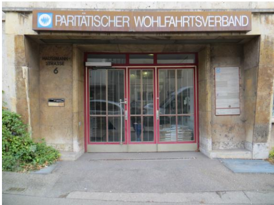
Vergangenheit: Haußmannstraße 6

Im Dezember 2013 war es soweit: nach 19 Jahren musste der Landesverband aus dem Sozialzentrum des Paritätischen in der Haußmannstraße ausziehen, da der Paritätische den Standort aufgab. Die Umzugspläne bestanden seit 2008.