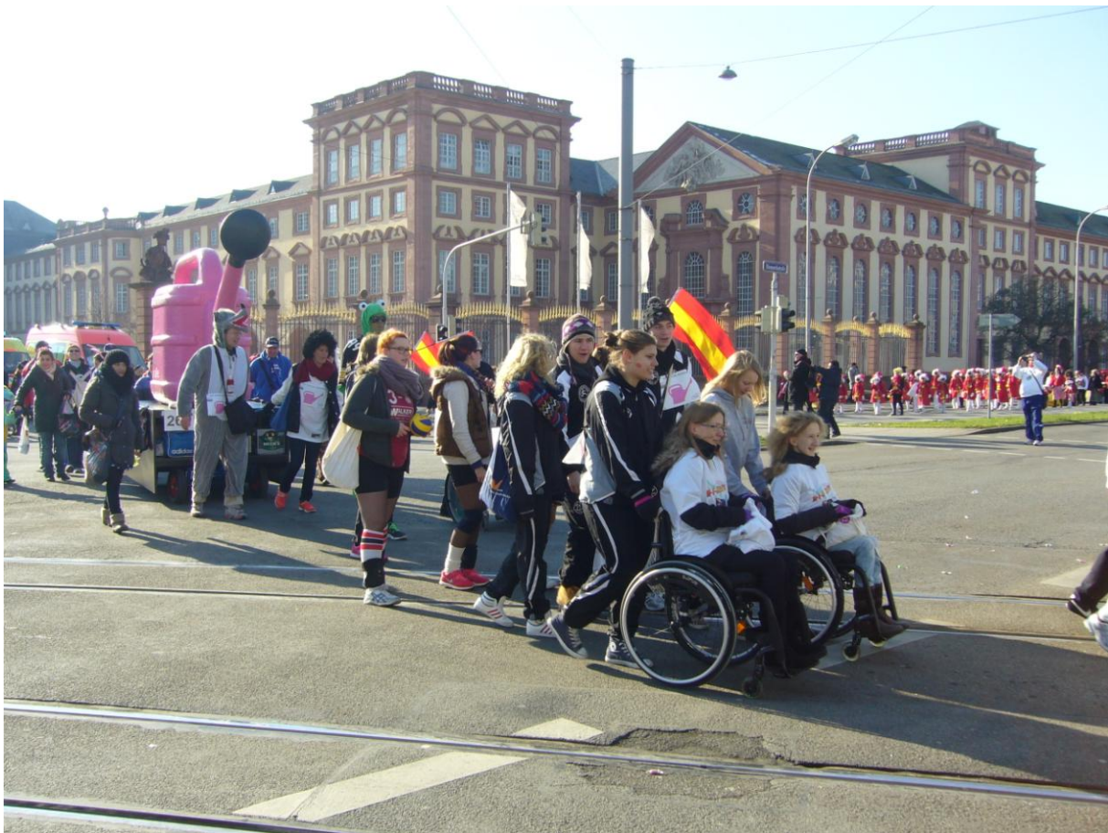
Mittendrin! Faschingsumzug Mannheim

„Alle inklusive – dafür setzen wir uns ein!“