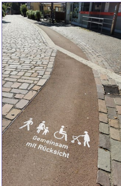
„Gemeinsam mit Rücksicht“ lautet das Motto in der Preisträgergemeinde Kirchzarten. Ein barrierefreies Mobilitätsband führt durch die Fußgängerzone.